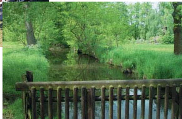
(Brücke über dem am Haus gelegenen Rehbach)